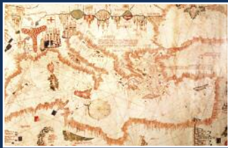
Copia risalente al 1480 del Portolano di Albino de Canepa

30 settembre - 24 ottobre 2010 PALAZZO DELLE ESPOSIZIONI Spazio Fontana, ingresso via Milano, 13